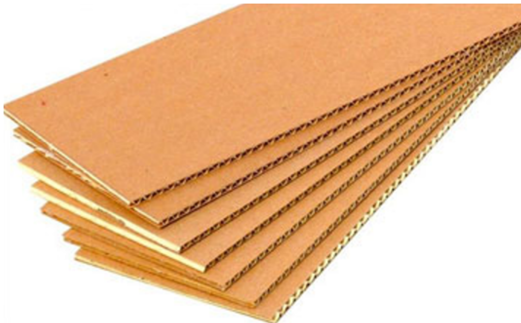
Сурет 1- Қайта өңделген картон

Жұқа тазалауда бір-бірін толықтыратын әртүрлі тәсілдермен жүзеге асырылады, өйткені кейбір бір әдіс макулатураның қажетті тазалығын қамтамасыз етпейді. Әдетте жұқа тазалау осы ретпен өтеді: сұрыптау құрылғысын пайдалану; термодисперсиялық құрылғының көмегімен. Көмегімен тазалау - әрі қарай тазалауды әртүрлі қосымша жабдықтардың көмегімен жасауға болады, оны төменде егжей-тегжейлі қарастырамыз [10, 49-57 с.].