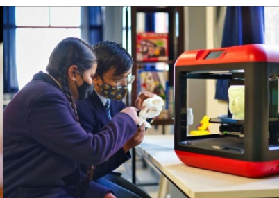
2 сурет. Машиналық оқыту