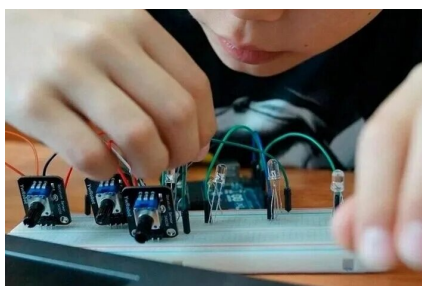
1 сурет. Ардуино тексеру жүйелері

Алайда бұл платформаларда ЖИ толық деңгейде пайдаланылып отырған жоқ, көбіне автоматтандырумен шектеледі. Эмоционалды интеллектті тану немесе когнитивті модельдеу сияқты мүмкіндіктер әлі кең қолданылмаған [13, б. 20].