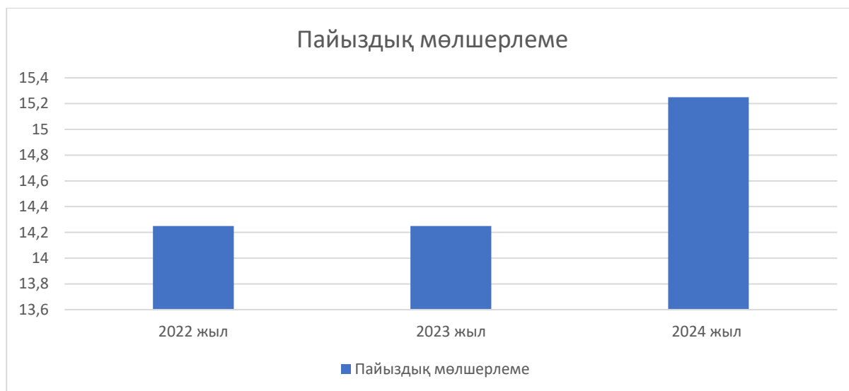
Сурет 2 - Қазақстан Ұлттық Банкінің пайыздық мөлшерлемесінің өзгеруі.

Ұлттық Банк теңгенің құнсыздануын сыртқы және ішкі факторлардың жиынтығымен байланыстырды. Азық-түлік тауарларының әлемдік бағасының өсуі және негізгі сауда серіктестерінің, әсіресе Ресейдің валюталарының құбылмалылығы Қазақстан ішіндегі бағаның өсуін жеделдетті. Сонымен қатар, АҚШ долларының нығаюы және дамушы нарықтардағы валюталардың ауытқуы Қазақстандық валютаға қысымды күшейтті. Нәтижесінде 2024 жылға арналған инфляция болжамдары 8-9%-ға дейін қайта қаралды, ал 2025 және 2026 жылдарға арналған болжамдар сәйкесінше 6,5–8,5% және 5,5-7,5% - ға түзетілді. Бұл түзетулер фискалдық ынталандырудың кеңеюі, коммуналдық сектордағы жүргізіліп жатқан реформалар, валюта бағамының қысымы және сыртқы инфляциялық қысымның жоғарылауы сияқты әртүрлі факторларды ескерді.