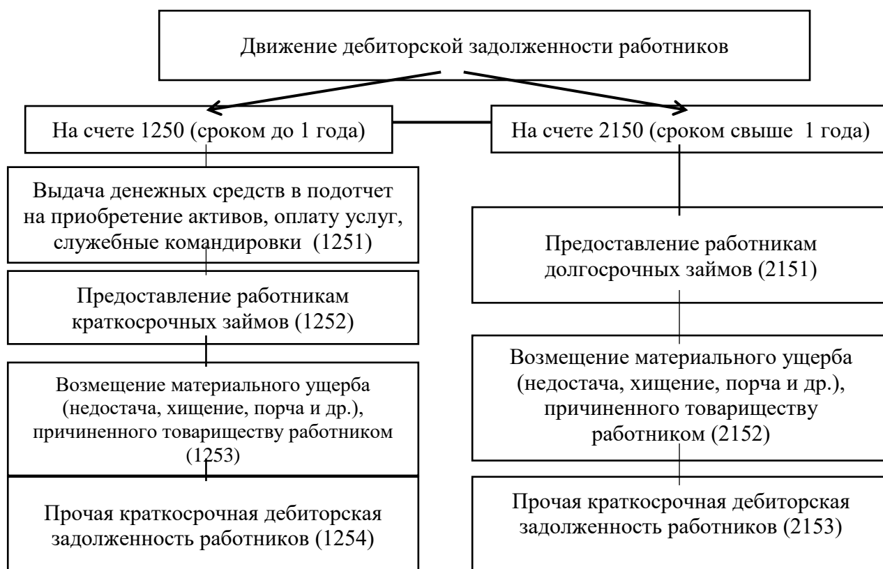
Рисунок 2 – Отражение операций, связанных с движением дебиторской задолженности работников

На рисунке 2 показаны транзакции, связанные с движением с движением дебиторской задолженности работников.